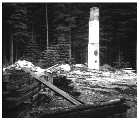
Z rekonstruované chaty Komín zbyl ke konci roku pouze komín.

Poprvé jsme pro těžbu použili těžební stroj zvaný harvester, provedli jsme rekonstrukci dřevomorkou sežrané chaty Komín, pro návštěvníky lesa jsme zhotovili u cesty Horní poválky odpočívadlo s parkovištěm, které však mělo díky návštěvníkům velmi krátkou životnost, pro techniku jsme koupili dvě garáže v bývalých kasárnách a jako adjunkt nastoupil Tomáš Suchý.